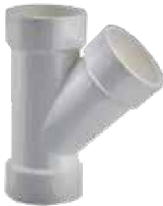
YEE Disponible de 1 1/2 a 6 pulgadas