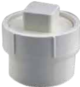
ADAPTADOR CON TAPA REGISTRO Disponible de 1 1/2 a 6 pulgadas