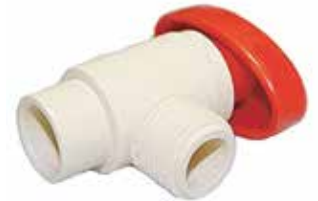
VÁLVULA ANGULAR Disponible de 1/2 pulgada