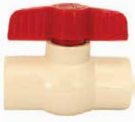
VÁLVULA ESFERA Disponible de 1/2 a 2 pulgadas