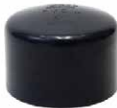
TAPÓN CACHUCHA Disponible de 1/2 a 6 pulgadas