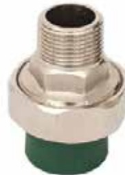
TUERCA UNIÓN MACHO Disponible de 20 mm a 63 mm