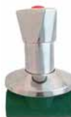
LLAVE DE EMPOTRAR Disponible de 20 mm