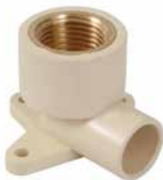
CODO OREJA CON INSERTO DE BRONCE Disponible de 1/2 pulgada