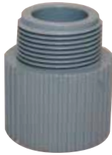
ADAPTADOR MACHO Disponible de 1/2 a 2 pulgadas