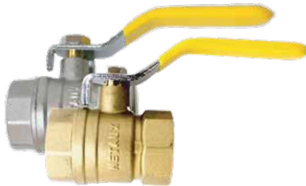
VÁLVULAS ESFERA 300 Y 400 LBS Disponible de 1/4 a 4 pulgadas