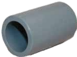
COPE Disponible de 1/2 a 6 pulgadas