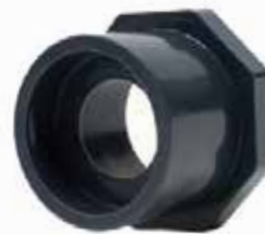
REDUCCIÓN BUSHING Disponible de 1/2 a 4 pulgadas