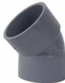
CODO 45 Disponible de 1/2 a 6 pulgadas