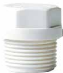
TAPÓN MACHO Disponible de 1/2 a 1 pulgada