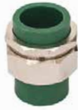
TUERCA UNIÓN CON INSERTO Disponible de 20 mm a 63 mm