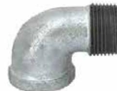
CODO NIPLA Disponible de 1/2 a 4 pulgadas