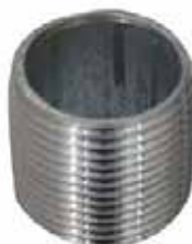
NIPLA Disponible 1/4 a 4 pulgadas