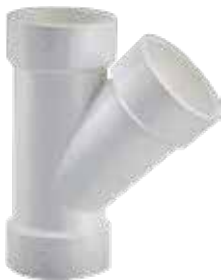
YEE Disponible de 1/2 a 6 pulgadas