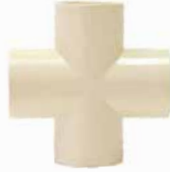
CRUZ Disponible de 1/2 a 3/4 de pulgada