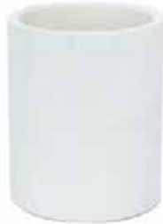
COPE Disponible de 1/2 a 6 pulgadas