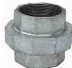
TUERCA UNIÓN Disponible de 1/2 a 4 pulgadas