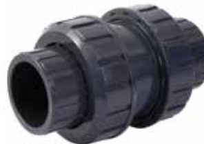
VÁLVULA CHECK Disponible de 1/2 a 2 pulgadas