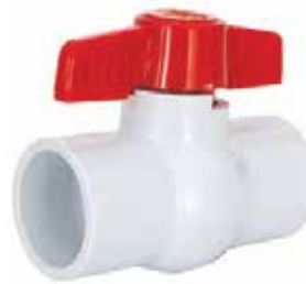
VÁLVULA ESFERA Disponible de 1/2 a 4 pulgadas