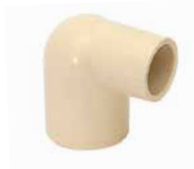
CODO REDUCCIÓN Disponible de 3/4 a 1/2 pulgada