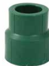
REDUCCIÓN BUSHING Disponible de 25 x 20 mm 32 x 20 mm y 32 x 25 mm