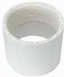
ADAPTADOR HEMBRA Disponible de 1/2 a 4 pulgadas