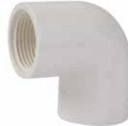
CODO ROSCADO 90° Disponible de 1/2 a 1 pulgada