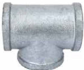
TEE Disponible de 1/2 a 4 pulgadas