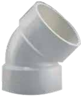
CODO 45° Disponible de 1 1/2 a 6 pulgadas