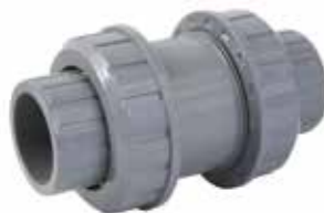
VÁLVULA CHECK Disponible de 1 1/2 y 2 pulgadas