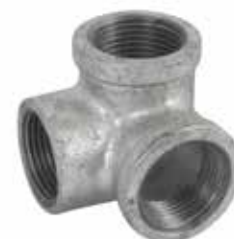
CODO RINCÓN Disponible de 1/2 a 1 pulgada