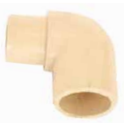
CODO PIPA Disponible en 1/2 pulgada