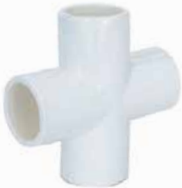
CRUZ Disponible de 1/2 a 1 pulgada