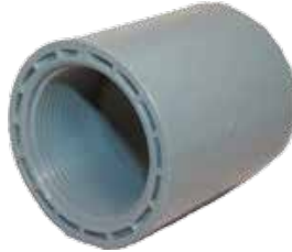
ADAPTADOR HEMBRA Disponible de 1/2 A 4 pulgadas