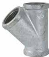
YEE Disponible de 1/2 a 1 pulgada