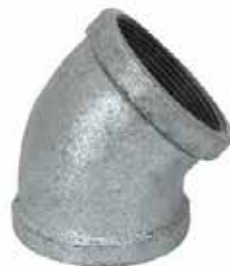
CODO 45° Disponible de 1/2 a 4 pulgadas