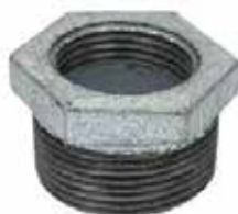
REDUCCIÓN BUSHING Disponible de 1/2 a 3 pulgadas