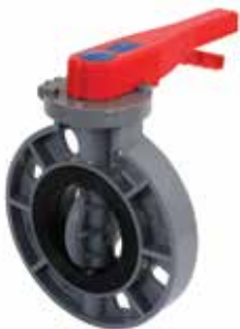
VÁLVULA MARIPOSA Disponible de 2 a 8 pulgadas