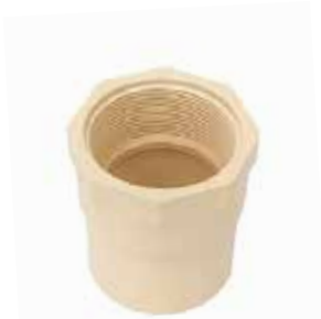
ADAPTADOR HEMBRA Disponible de 1/2 a 2 pulgadas