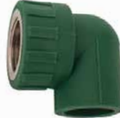
CODO HEMBRA Disponible de 20 mm a 63 mm