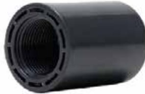
ADAPTADOR HEMBRA Disponible de 1/2 a 6 pulgadas