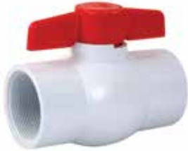
VÁLVULA ESFERA ROSCADA Disponible de 1/2 a 4 pulgadas