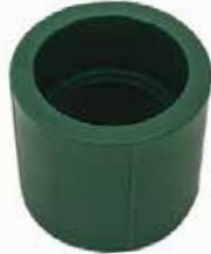
COPE Disponible de 20 mm a 63 mm