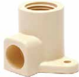
CODO OREJA Disponible de 1/2 pulgada