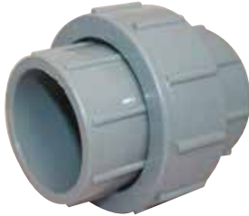
TUERCA UNIÓN Disponible de 1 1/2 a 4 pulgadas