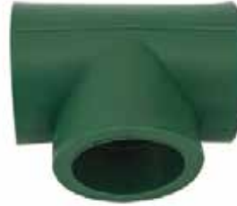
TEE Disponible de 20 mm a 63 mm