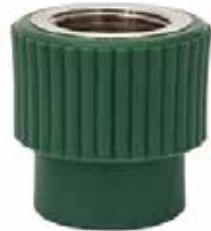
ADAPTADOR HEMBRA Disponible de 20 mm a 63 mm