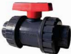
VÁLVULA UNIÓN DOBLE Disponible de 1/2 a 6 pulgadas