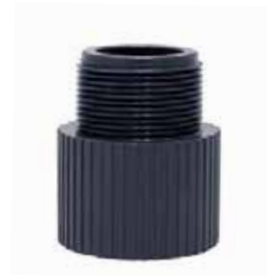
ADAPTADOR MACHO Disponible de 1/2 a 6 pulgadas