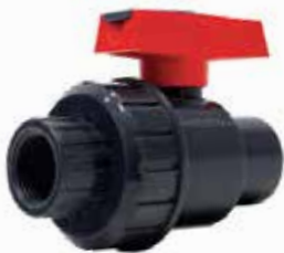
VÁLVULA UNIÓN SENCILLA Disponible de 1/2 a 4 pulgadas