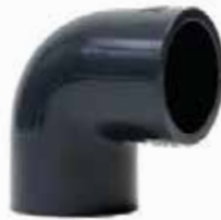
CODO 90° Disponible de 1/2 a 8 pulgadas