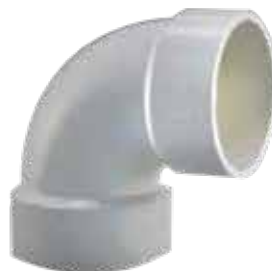
CODO 90° Disponible de 1 1/2 a 6 pulgadas