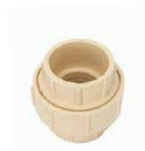
TUERCA UNIÓN Disponible de 1/2 a 2 pulgadas