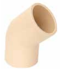
CODO 45° Disponible de 1/2 a 2 pulgadas