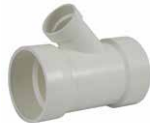
YEE REDUCCIÓN Disponible de 4 x 2 pulgadas