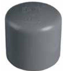
TAPÓN CACHUCHA Disponible de 1/2 a 6 pulgadas