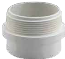
ADAPTADOR MACHO Disponible de 1 1/2 a 4 pulgadas