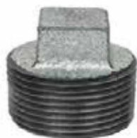
TAPÓN MACHO Disponible de 1/2 a 4 pulgadas