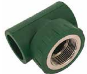
TEE HEMBRA Disponible de 20 mm a 63 mm