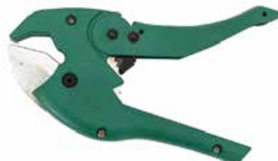
TIJERA CORTA TUBO