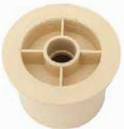
REDUCCIÓN BUSHING Disponible de 1/2 a 2 pulgadas