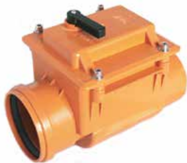
VÁLVULA CHECK ANTI RETORNO REFORZADA Disponible de 4 a 8 pulgadas