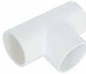
TEE Disponible de 1/2 a 6 pulgadas