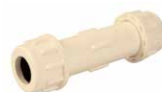
COPE COMPRESIÓN Disponible de 1/2 pulgada