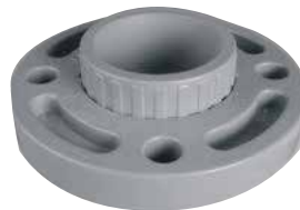
BRIDA MOVIBLE Disponible de 2 a 8 pulgadas