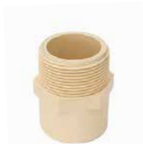
ADAPTADOR MACHO Disponible de 1/2 a 2 pulgadas