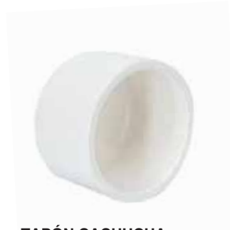
TAPÓN CACHUCHA ROSCADO Disponible de 1/2 a 1 pulgada