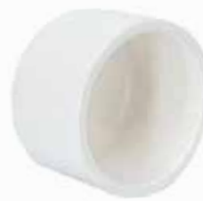
TAPÓN CACHUCA Disponible de 1/2 a 4 pulgadas