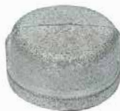
TAPÓN CACHUCHA Disponible de 1/2 a 4 pulgadas