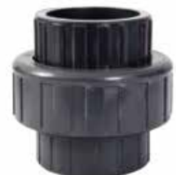
TUERCA UNIÓN Disponible de 1/2 a 2 pulgadas