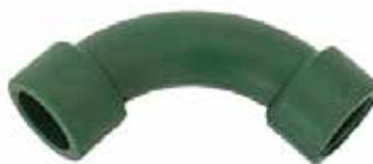
CURVA 90° Disponible de 20 mm a 32 mm