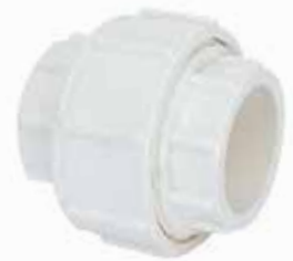
TUERCA UNIÓN Disponible de 1/2 a 4 pulgadas