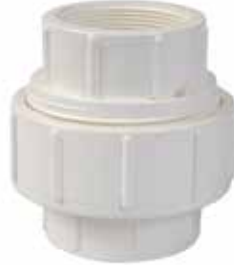
TUERCA UNIÓN ROSCADA Disponible de 1/2 a 2 pulgadas