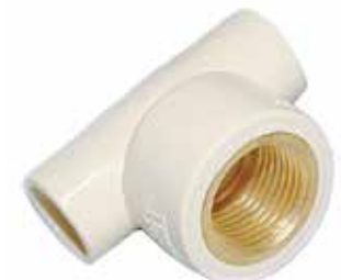
TEE CON INSERTO DE BRONCE Disponible de 1/2 a 3/4 de pulgada