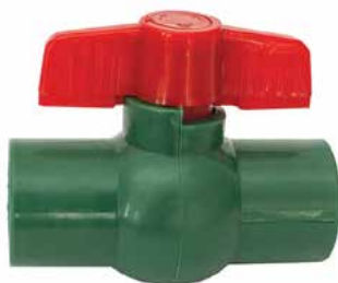
VÁLVULA ESFERA Disponible de 20 mm a 32 mm