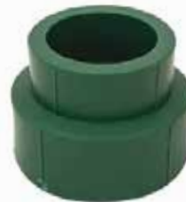
COPE REDUCCIÓN Disponible de 1/2 a 2 pulgadas