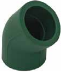
CODO 45° Disponible de 20 mm a 63 mm