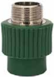
ADAPTADOR MACHO Disponible de 20 mm a 63 mm