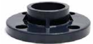
BRIDA MOVIBLE Disponible de 2 a 8 pulgadas