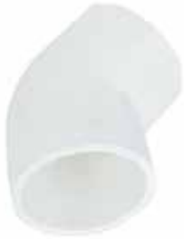
CODO 45° Disponible de 1/2 a 6 pulgadas