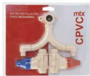
KIT DE REGADERA