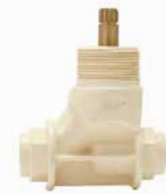
LLAVE DE EMPOTRAR Disponible de 1/2 pulgada