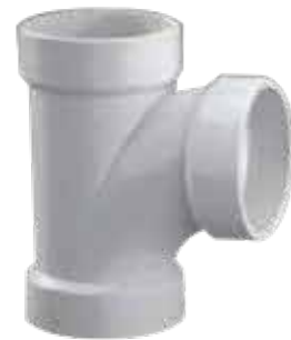
TEE Disponible de 1 1/2 a 6 pulgadas