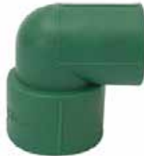
CODO REDUCCIÓN Disponible de 3/4 a 1/2 pulgada