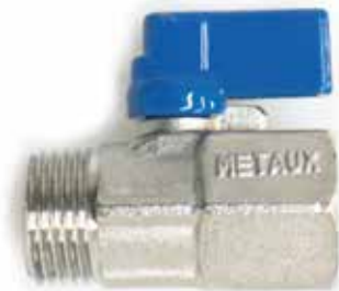
VÁLVULA ANGULAR DE LATÓN Disponible de 1/2 pulgada