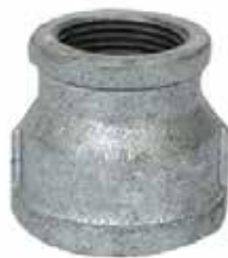
REDUCCIÓN CAMPANA Disponible de 1/2 a 4 pulgadas