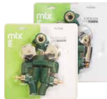
KIT PARA REGADERA