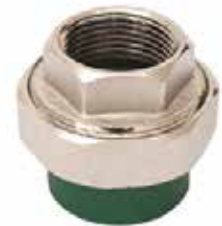
TUERCA UNIÓN HEMBRA Disponible de 20 mm a 63 mm