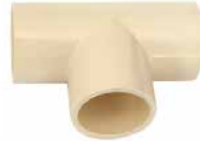
TEE Disponible de 1/2 a 2 pulgadas