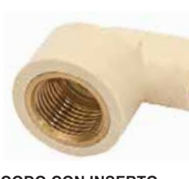
CODO CON INSERTO DE BRONCE Disponible en 1/2 y 3/4 pulgada