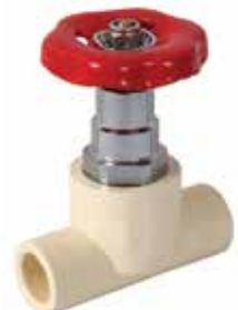
VÁLVULA GLOBO Disponible de 1/2 a 3/4 de pulgada