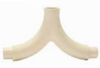
MEZCLADOR Disponible de 1/2 pulgada