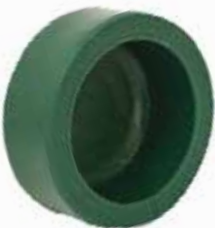
TAPÓN CACHUCHA Disponible de 20 mm a 63 mm