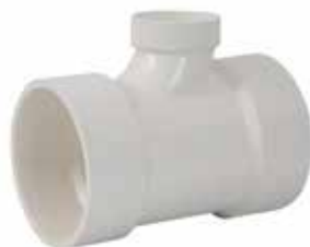
TEE REDUCCIÓN Disponible de 4 x 2 pulgadas