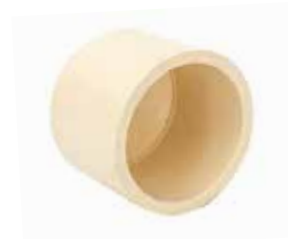
TAPÓN CACHUCHA Disponible de 1/2 a 2 pulgadas