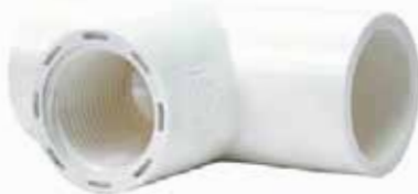
TEE ROSCADA Disponible de 1/2 a 3/4 de pulgada