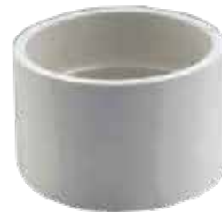
COPE Disponible de 1 1/2 a 6 pulgadas