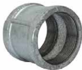
COPE Disponible de 1/2 a 4 pulgadas