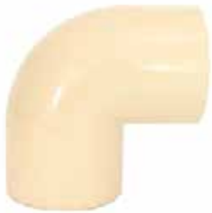
CODO 90° Disponible de 1/2 a 2 pulgadas