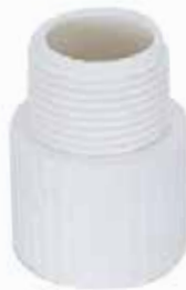
ADAPTADOR MACHO Disponible de 1/2 a 4 pulgadas