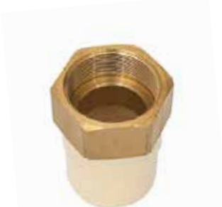
ADAPTADOR HEMBRA CON INSERTO DE LATÓN Disponible de 1/2 a 2 pulgadas