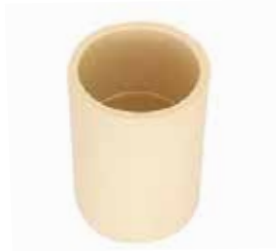
COPE Disponible de 1/2 a 2 pulgadas