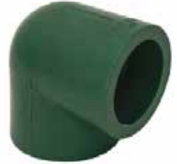
CODO 90° Disponible de 20 mm a 63 mm