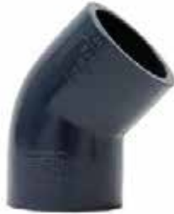
CODO 45° Disponible de 1/2 a 8 pulgadas

Sistema de conexiones disponible de 1/2 a 6 pulgadas - METAUX