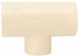
TEE REDUCCIÓN Disponible de 3/4 a 1/2 pulgada