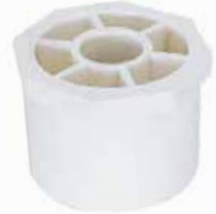
REDUCCIÓN BUSHING Disponible de 1/2 a 4 pulgadas