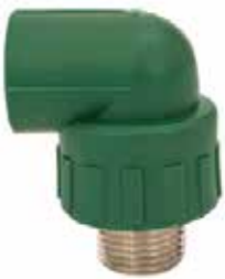
CODO MACHO Disponible de 20 mm a 63 mm