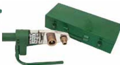
TERMOFUSORA 800w Y 400w Con dados de 20mm a 64mm