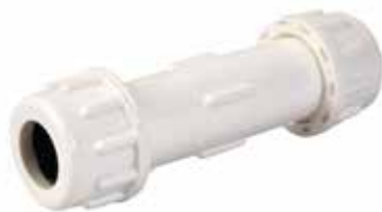
COPLE COMPRESIÓN Disponible de 1/2 pulgada