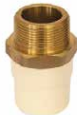
ADAPTADOR MACHO CON INSERTO DE LATÓN Disponible de 1/2 a 2 pulgadas