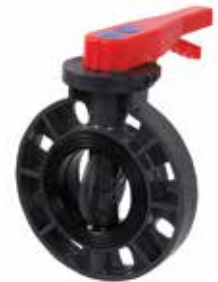
VÁLVULA MARIPOSA Disponible de 2 a 8 pulgadas