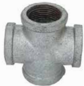
CRUZ Disponible de 1/2 a 4 pulgadas