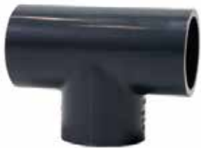
TEE Disponible de 1/2 a 8 pulgadas