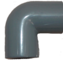
CODO 90° Disponible de 1/2 a 6 pulgadas