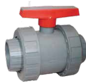
VÁLVULA UNIÓN DOBLE Disponible de 2 a 4 pulgadas