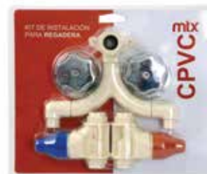
KIT DE REGADERA CON MANERALES