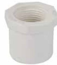
REDUCCIÓN BUSHING ROSCADA Disponible de 3/4 x 1/2 pulgada, 1 x 3/4 pulgada y 1 x 1/2 pulgada