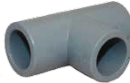
TEE Disponible de 1/2 a 6 pulgadas