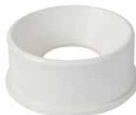
REDUCCIÓN BUSHING Disponible de 4 x 2 pulgadas, 4 x 3 pulgadas y 6 x 4 pulgadas