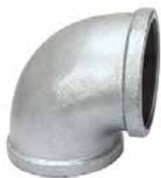
CODO 90° Disponible de 1/2 a 4 pulgadas

Sistema de conexiones disponible - METAUX de 1/2 a 4 pulgadas