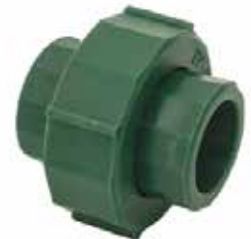
TUERCA UNIÓN LISA Disponible de 20 mm a 32 mm