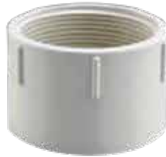
ADAPTADOR HEMBRA Disponible de 1 1/2 a 4 pulgadas