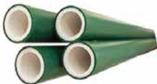
TUBO Disponible de 20 mm a 63 mm