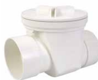
VÁLVULA CHECK ANTI RETORNO Disponible en 4 pulgadas