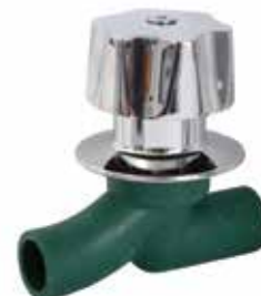
LLAVE DE EMPOTRAR Disponible de 20 mm