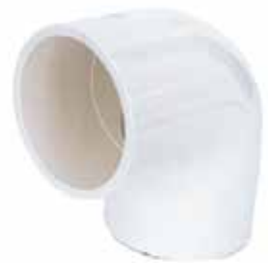
CODO 90° Disponible de 1/2 a 6 pulgadas