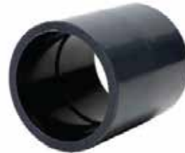
COPE Disponible de 1/2 a 8 pulgadas