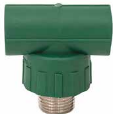
TEE MACHO Disponible de 20 mm a 63 mm